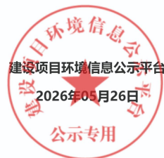
图 1 征求意见稿公示