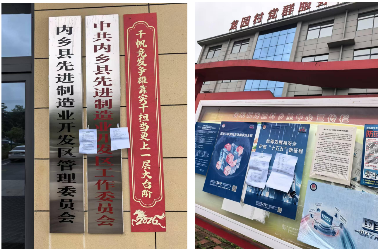
图 4 张贴公告

南阳锋源环保有限公司医疗废物处置项目于 2026 年 4 月 27 日，在内乡县先进制造业开发区及龙园村（后李岗等周边村庄所属行政村）张贴公告，张贴位置为项目所属开发区管委会及龙园村村委会。公示日期为 2026 年 4 月 27 日-2026 年 5 月 9 日（10 个工作日），具体见下图。