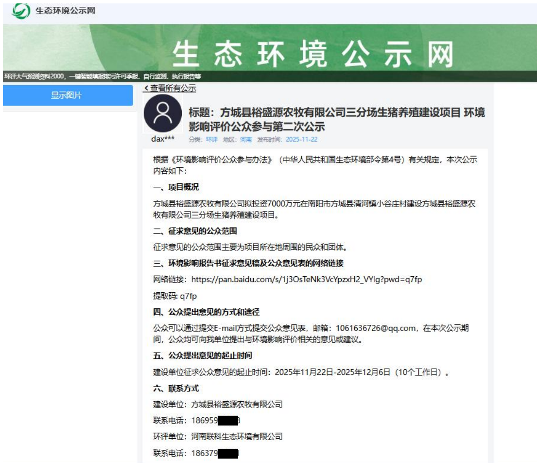
图 3.2-1 征求意见稿网络公示截图