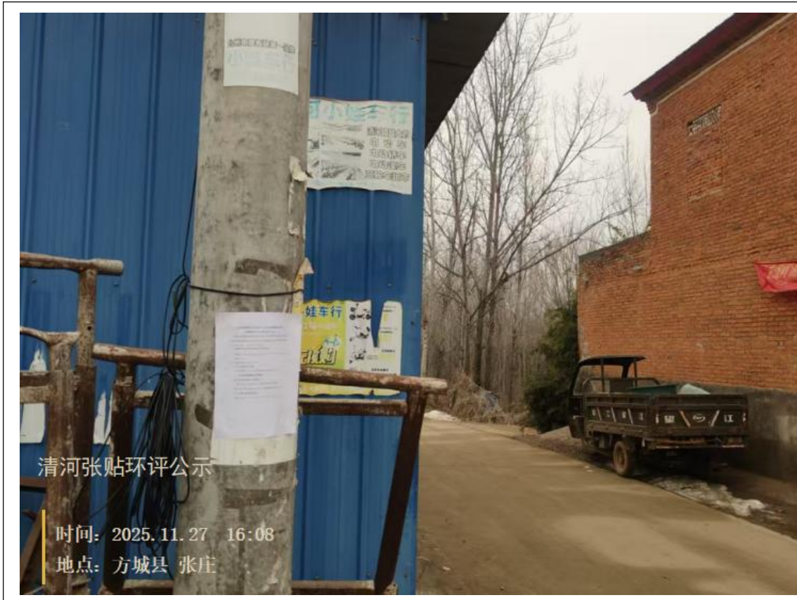
图 3.2-3 张贴公示