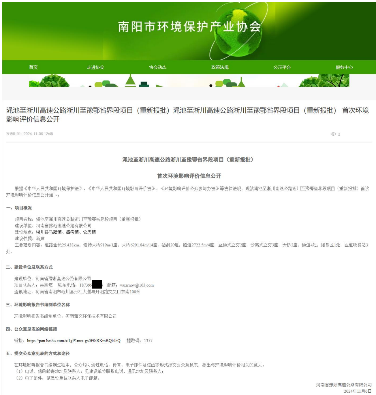
图 1 第一次网络公示截图