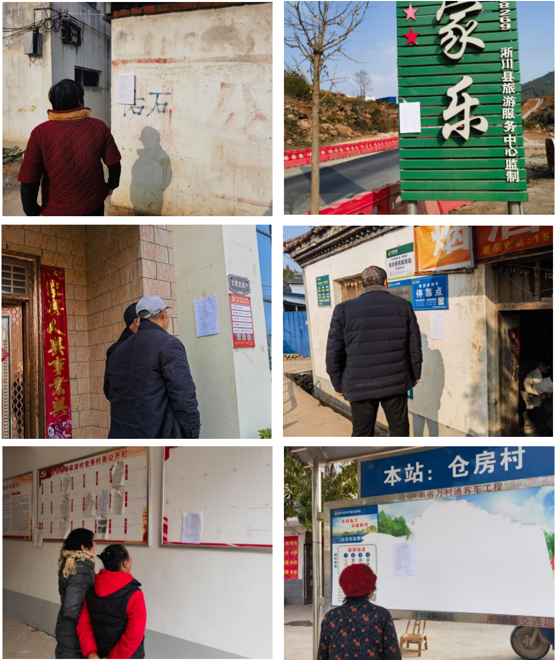
图 4 张贴公示照片