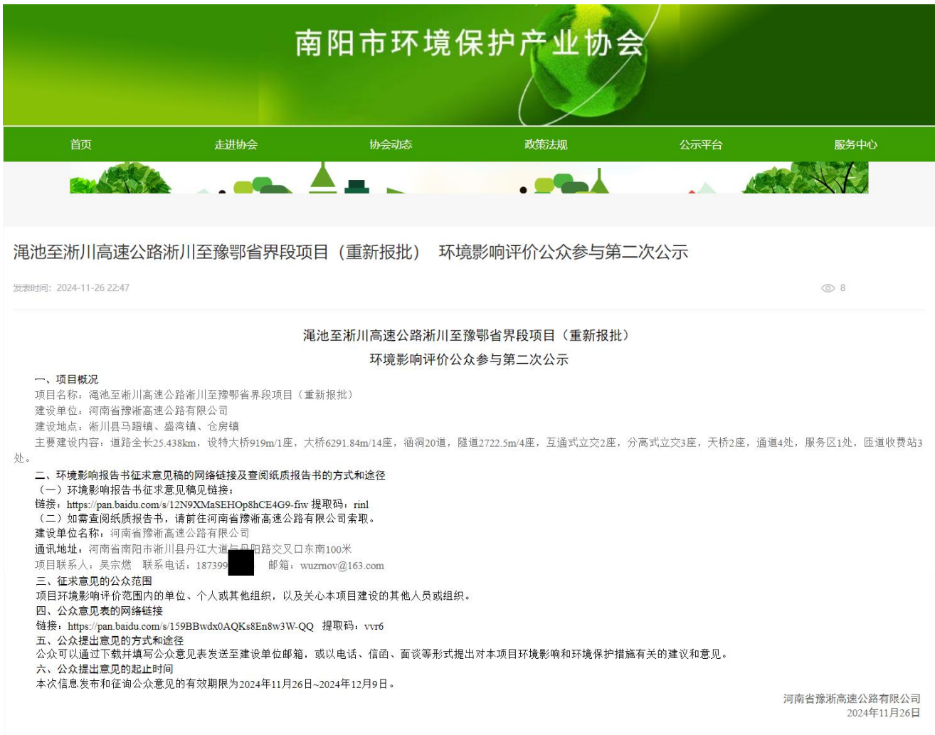
图 2 第二次网络公示截图