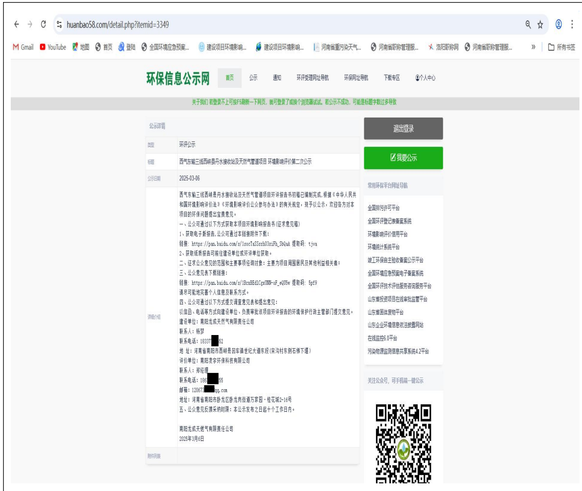
图二 网站第二次公示