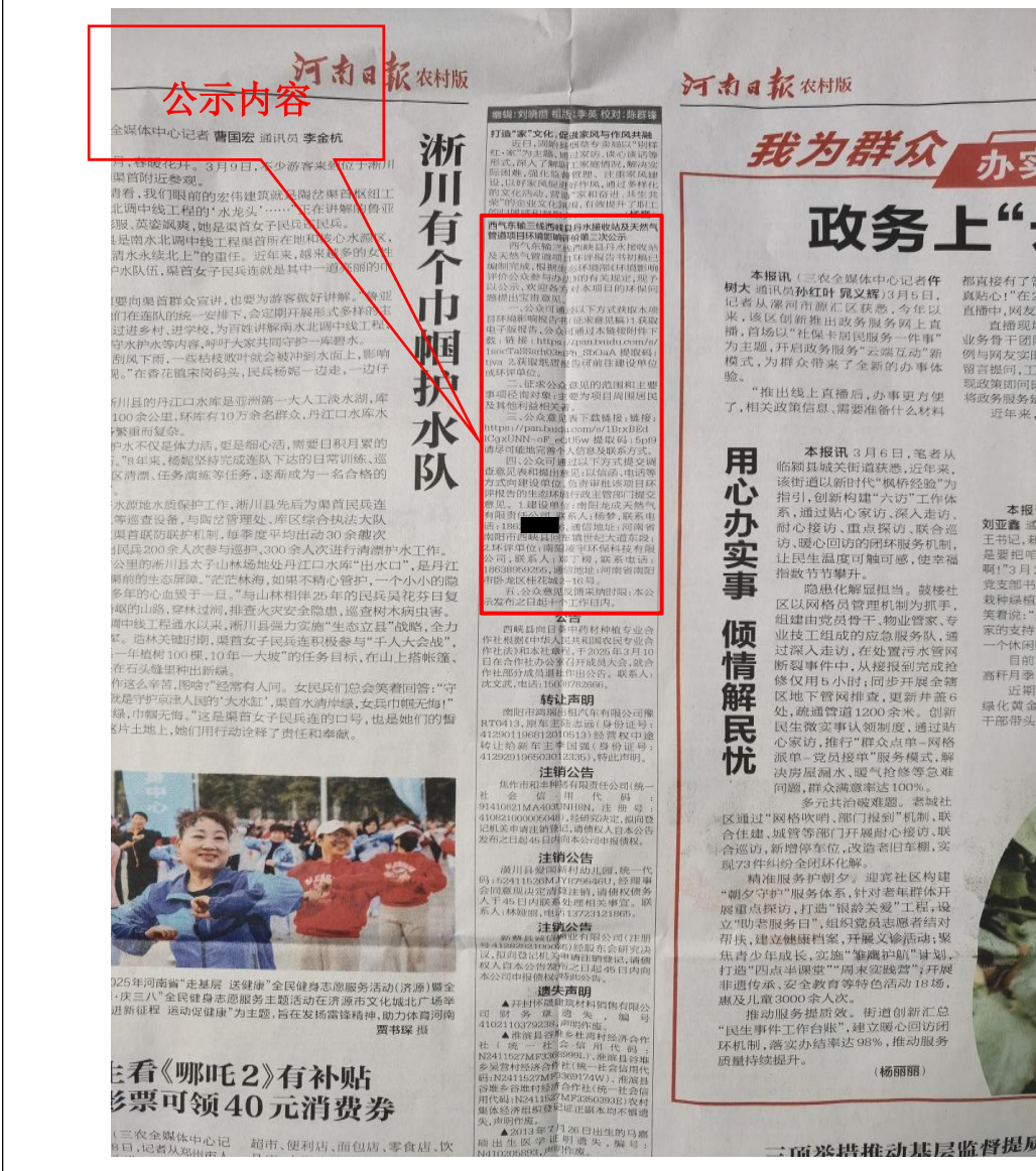
图三 报纸两次公示