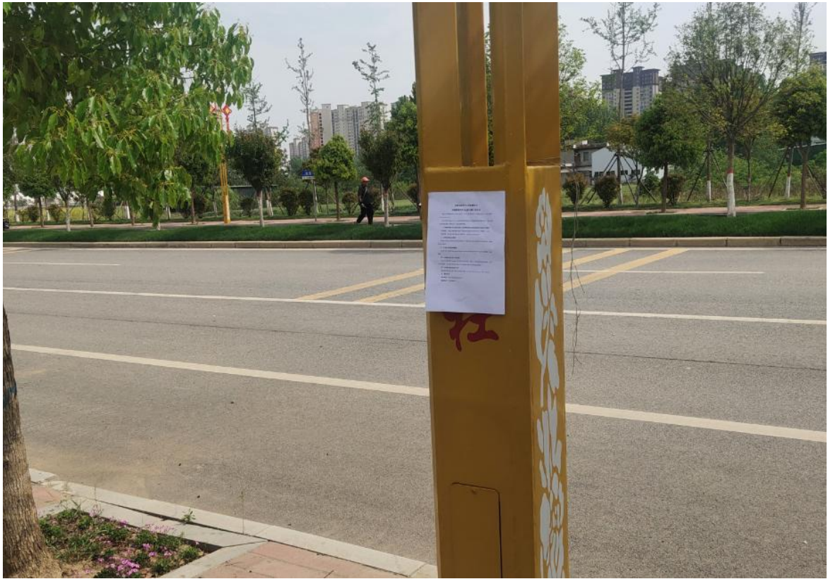
附图 4 现场张贴公告