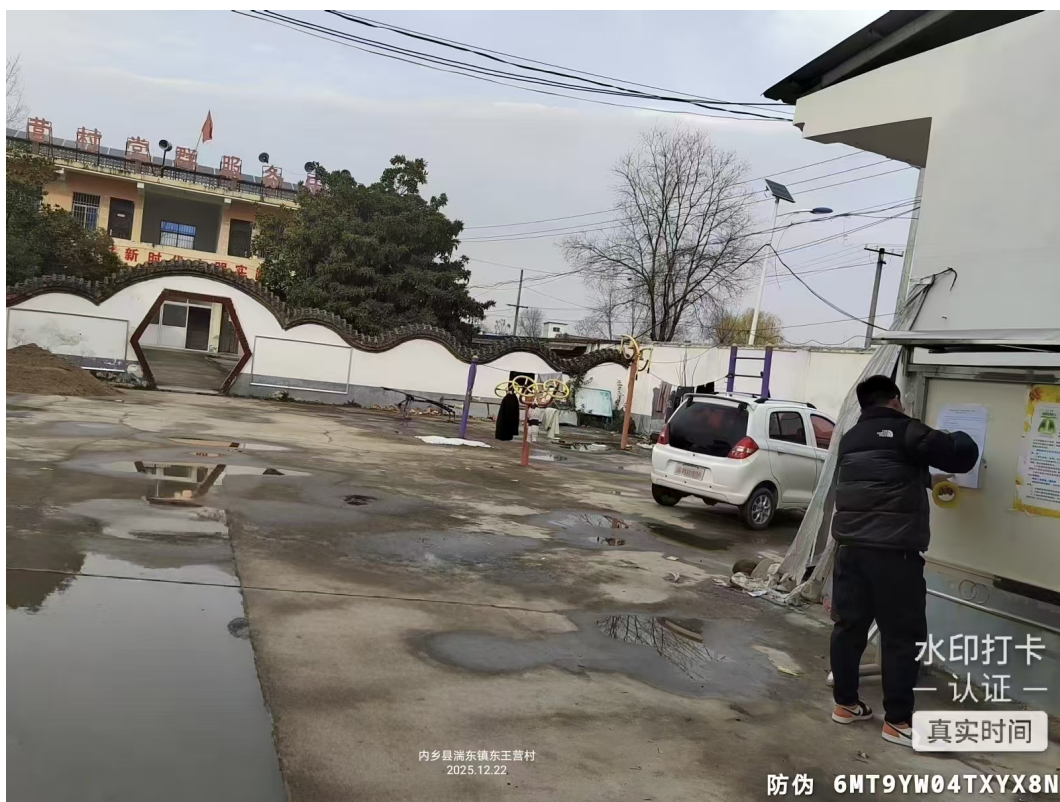
图 5 东王营村张贴公示