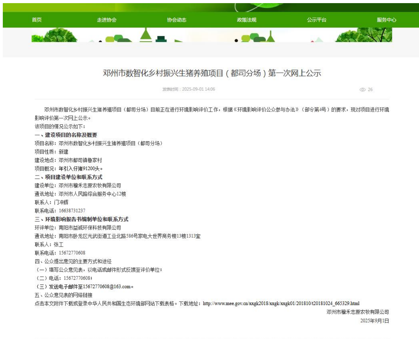
图2.2-1 首次环境影响评价信息公开网站截图

首次信息公开选择的网站为生态环境公示网站，符合《环境影响评价公众参与办法》中相关要求。