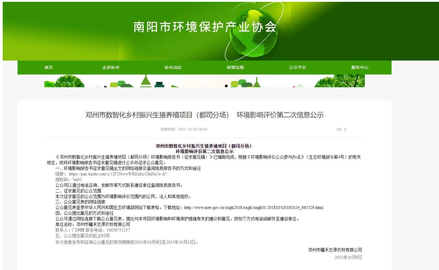
图 3.2-1 征求意见稿网站信息公开截图

项目环境影响报告书征求意见稿网络公开网站为生态环境公示网站，公示时间自2025年10月9日至2025年10月22日，共10个工作日。公示网址为： http://www.nyhbcy.cn/nd.jsp?id=394