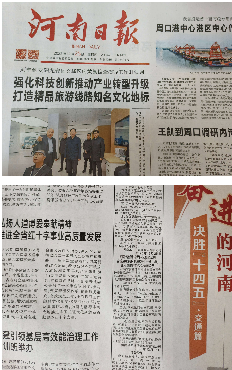
图9 2025年12月25日报纸公示