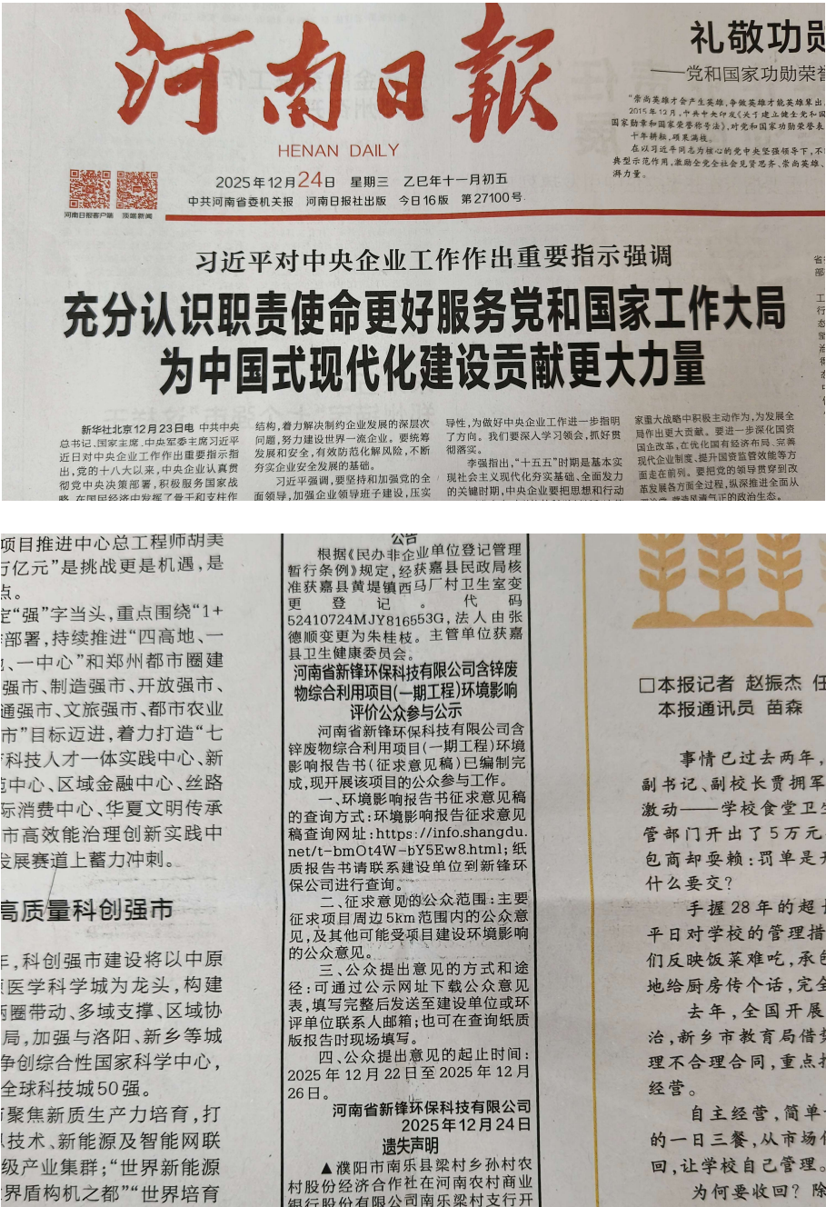
图 8 2025 年 12 月 24 日报纸公示

网络及张贴公示期间，我公司于 2025 年 12 月 24 日和 25 日在河南日报进行了两次登报公示，河南日报面向全省发行。公示主要内容与网络公示相同。具体见图 8 和图 9。