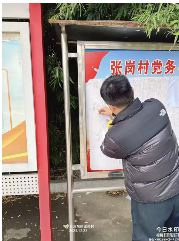
图 4 张岗村张贴公示