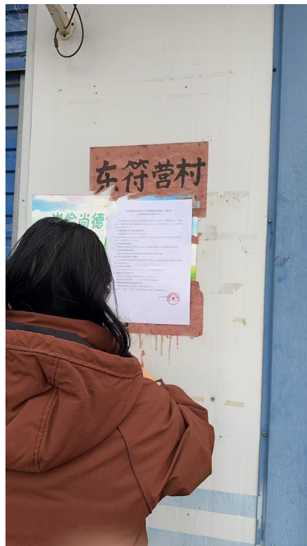
图 3 东符营村张贴公示