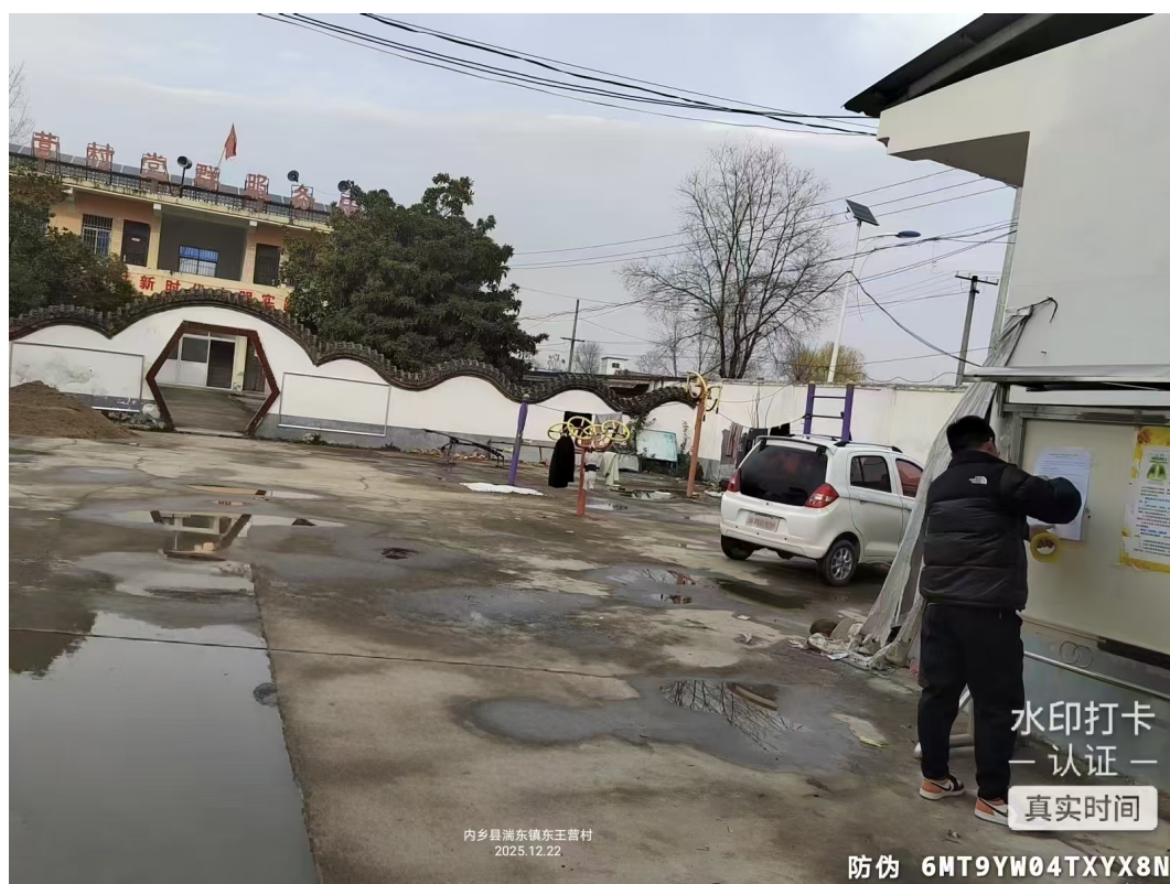
图 5 东王营村张贴公示