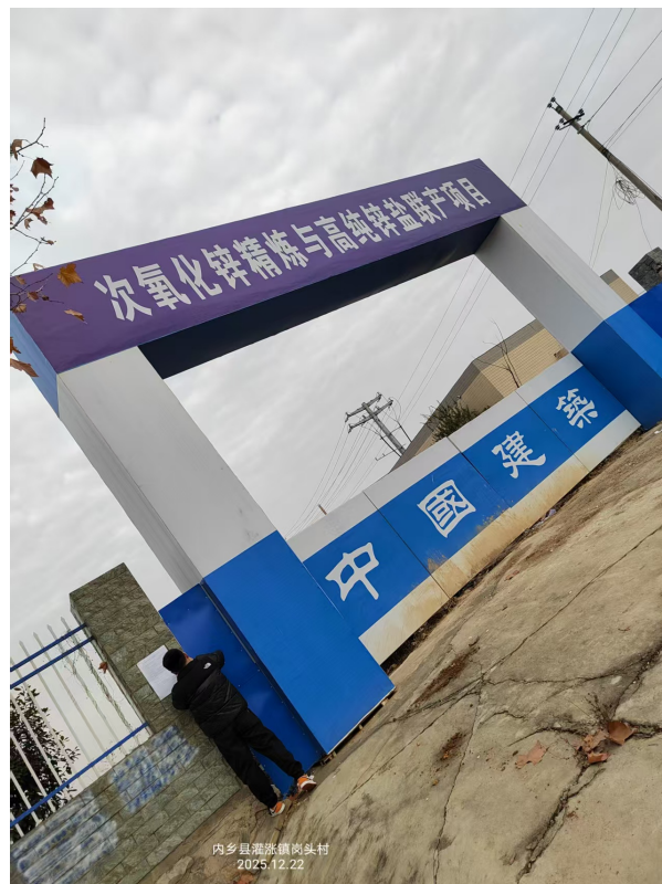
图 7 拟建厂址处张贴公示