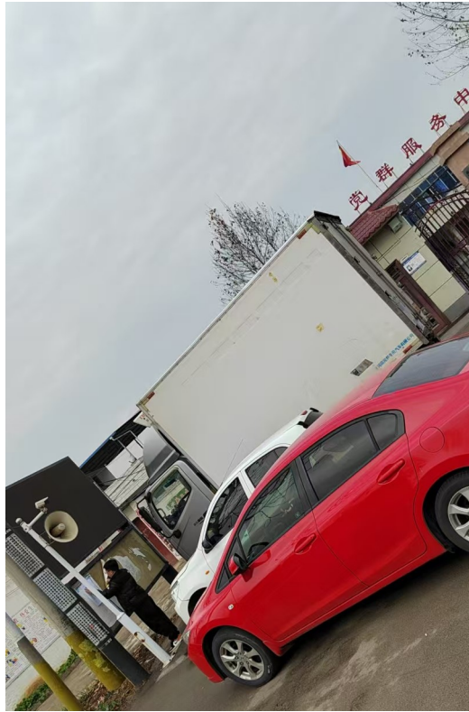
图 6 东王沟村张贴公示